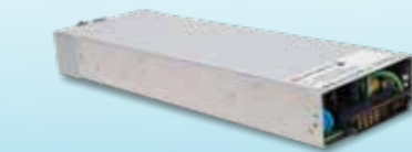
电源供应器/充电器 NCP-3200 长325.8x 宽107x 高41(1U) mm