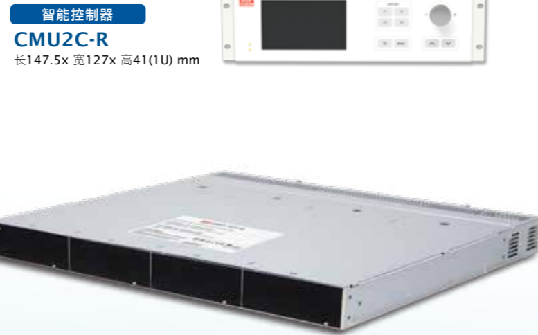
智能控制器 CMU2C-R 长147.5x 宽127x 高41(1U) mm